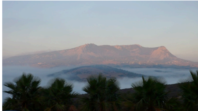
VILLA "LOS CÁRABOS"