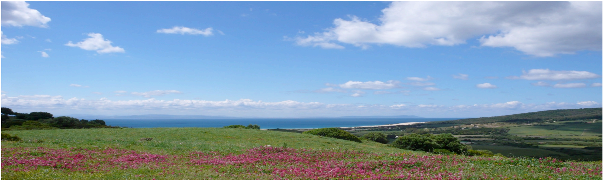
Blick von der Terrasse über das Grundstück auf den Atlantik