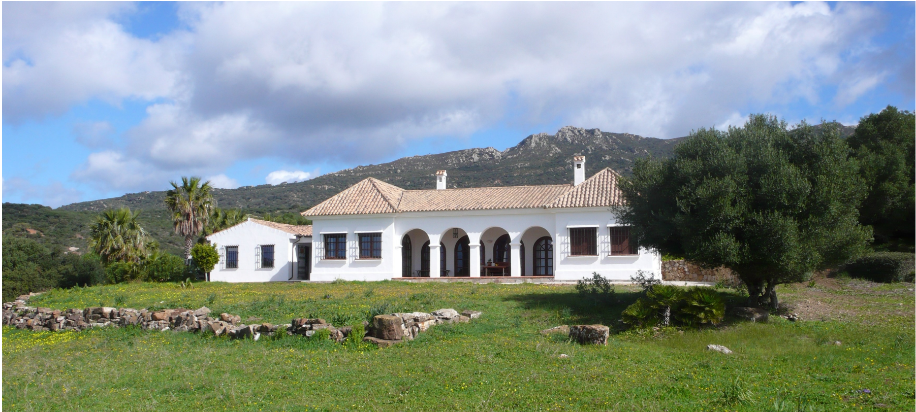
VILLA "LOS CÁRABOS" in Las Piñas